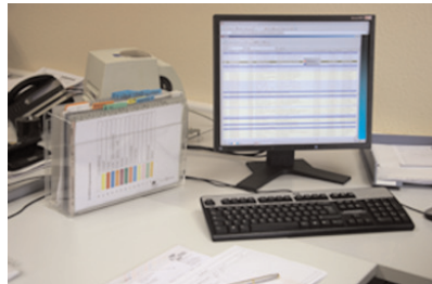
Aktuelle Unterlagen in der Acrylbox

Nach Projektende werden die Mappen komplett in der aktuellen Ordnung abgestellt, bei späterem Rückgriff sind daher auch alle Informationen schnell und leicht verfügbar.