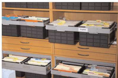
Projekte und ruhende Akten

Farben und alphabetische Ordnung garantieren eine klare Aktenstruktur. Jeder Vorgang erhält einen eindeutig definierten Platz. Jeder Mitarbeiter weiß, wo der Vorgang sein muss und findet ihn ohne zu suchen sofort - nicht nur der Stelleninhaber. Die Gewissheit nicht suchen zu müssen, bedeutet weniger Stress, erleichtert die Arbeit und bringt in der Kommunikation mit Kunden einen Imagegewinn, da jeder Mitarbeiter sofort auskunftsbereit ist.